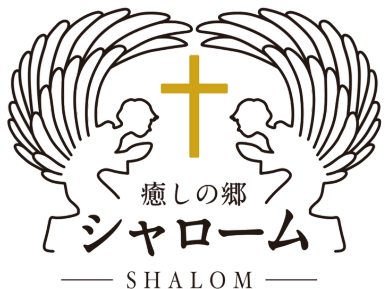
住宅型有料老人ホーム