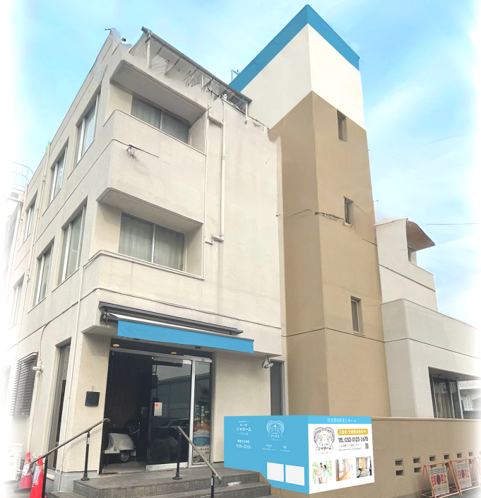
住宅型有料老人ホーム